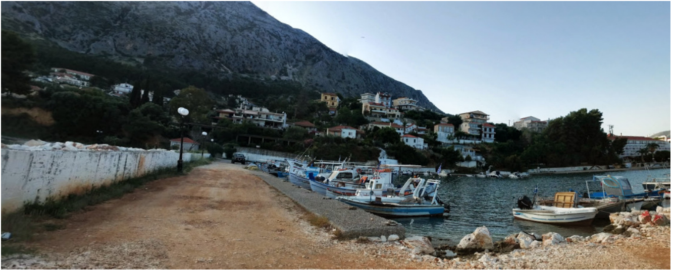
Εικόνα2: Υφιστάμενη κατάσταση

Το προτεινόμενο έργο αφορά την βελτίωση του αλιευτικού καταφυγίου Αστακού