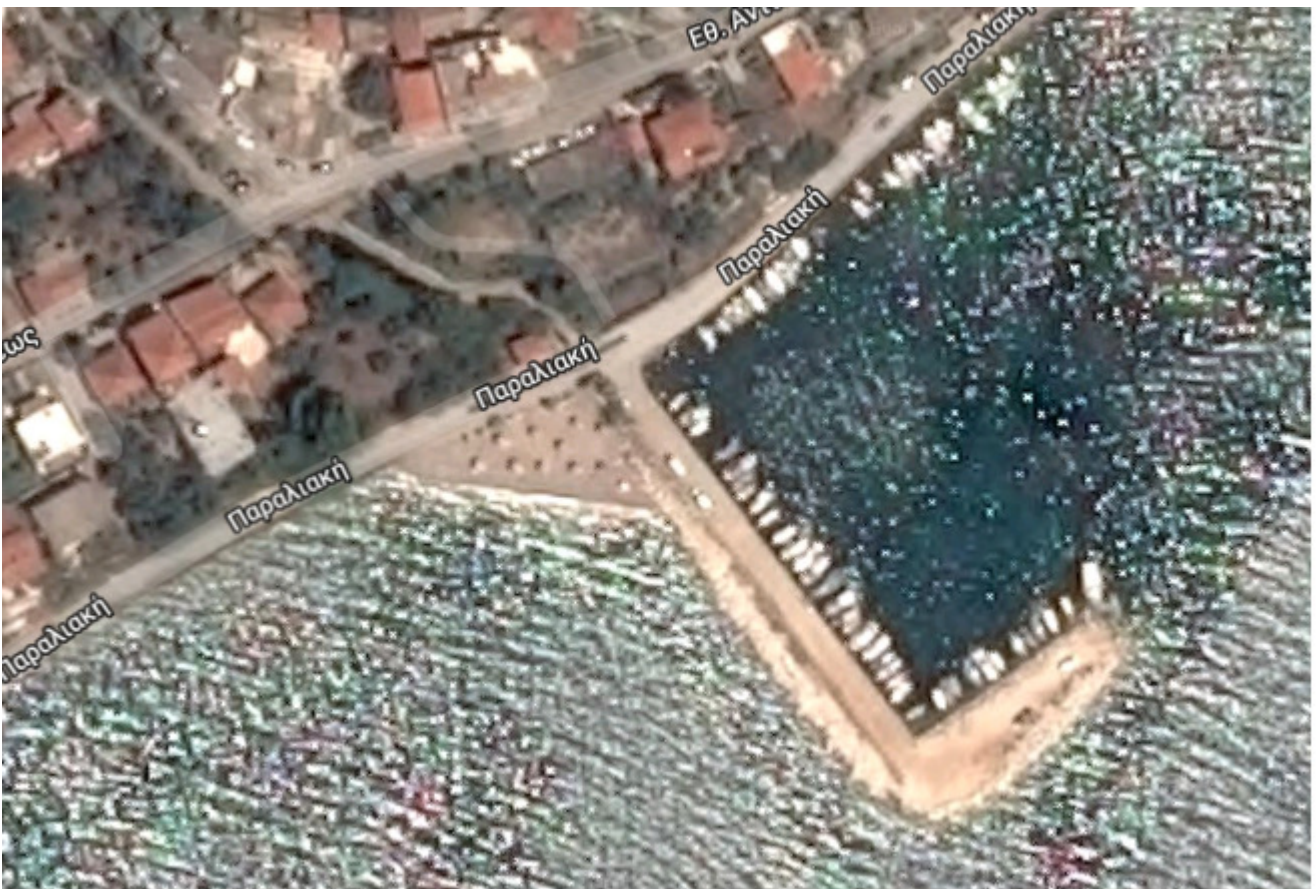
Εικόνα3: Χώρος παρέμβασης

Το προτεινόμενο έργο αφορά την βελτίωση του αλιευτικού καταφυγίου Αστακού