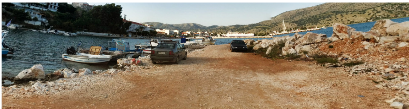
Εικόνα1: Υφιστάμενη κατάσταση

Το παρόν Τεχνικό Δελτίο αφορά την περιγραφή της υφιστάμενης κατάστασης του αλιευτικού καταφυγίου Αστακού. Η χερσαία ζώνη λιμένα στην περιοχή Αστακού καθορίστηκε με το ΦΕΚ149Δ'/08-03-1999.