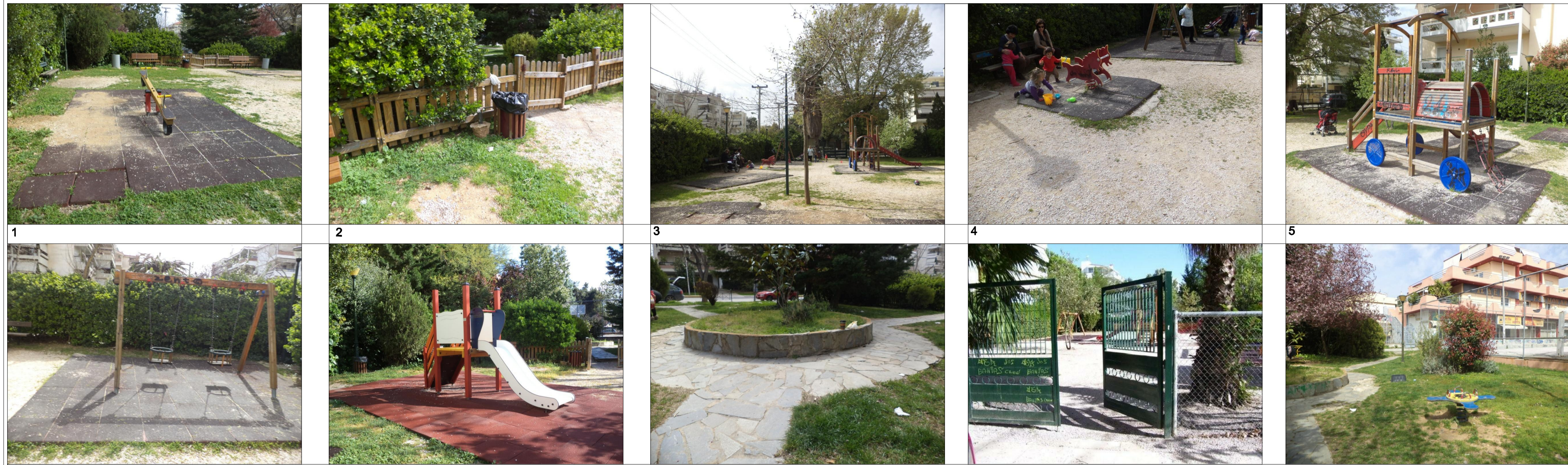
10 ΦΩΤΟΓΡΑΦΙΕΣ ΥΦΙΣΤΑΜΕΝΗΣ ΚΑΤΑΣΤΑΣΗΣ

ΝΑ ΣΥΝΤΗΡΗΘΟΥΝ- ΕΠΙΣΚΕΥΑΣΤΟΥΝ ΚΑΙ ΝΑ ΕΛΕΓΧΘΟΥΝ ΟΙ ΑΠΟΣΤΑΣΕΙΣ ΑΣΦΑΛΕΙΑΣ. ΥΠΑΡΧΕΙ ΠΙΣΤΟΠΟΙΗΤΙΚΟ. ΟΡΓΑΝΑ ΠΑΡΚΟΤΕΧΝΙΚΗΣ ΑΠΡΙΛΙΟΣ 2013.